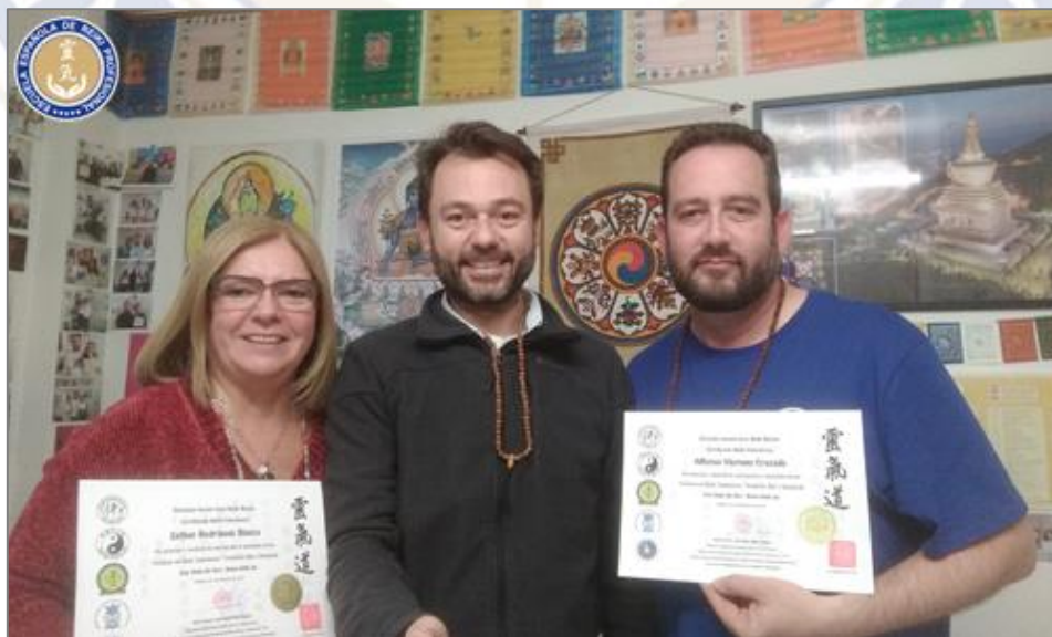
Curso Reiki Usui Japonés Nivel-3