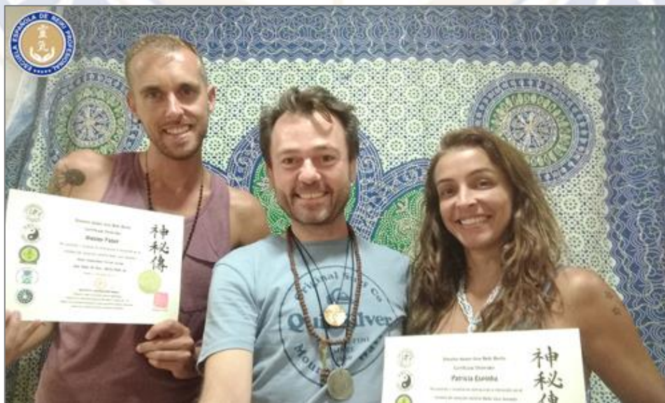
Curso Reiki Usui Japonés Nivel-3